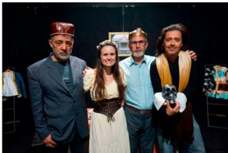
Produzindo teatro, atuando e dirigindo