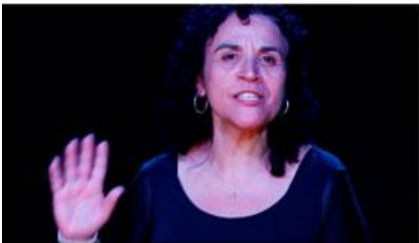
Ódio das coisas - Monólogo (2023)