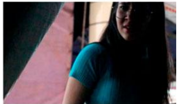
Passeio no parque + Suspense no parque - Improvisação para câmera (2024)