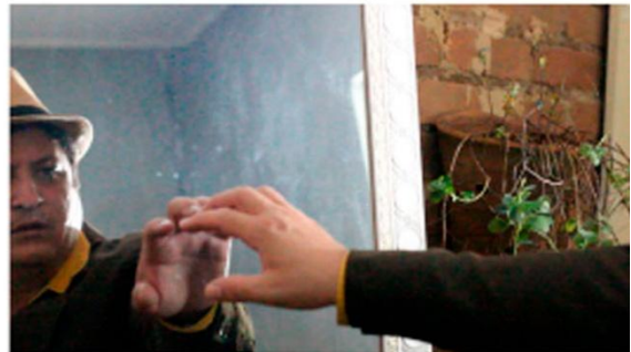
Depois do antes - Fantasia mística (2025)