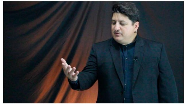
O rio que nos olha - Monólogo (2025)