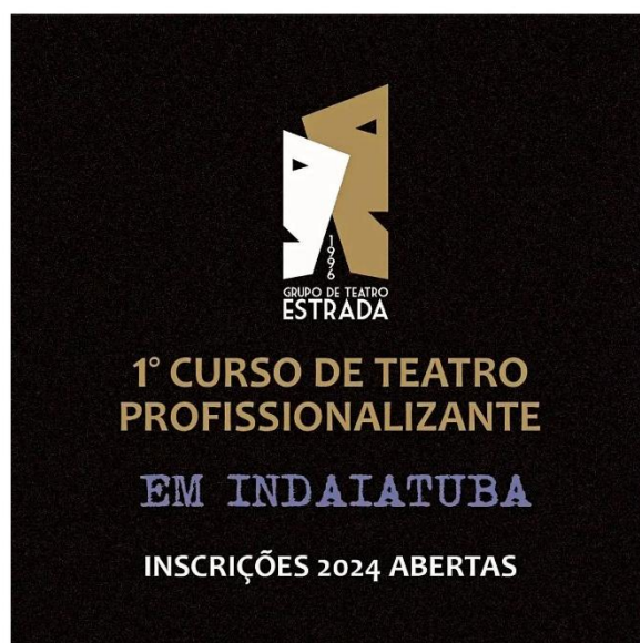
Inaugurando mostras e cursos em Indaiatuba