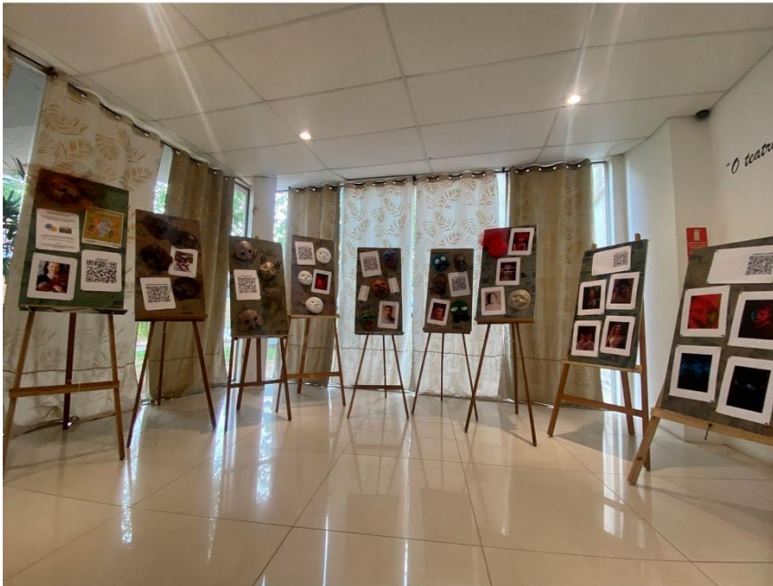
Exposição: Rostos revelados