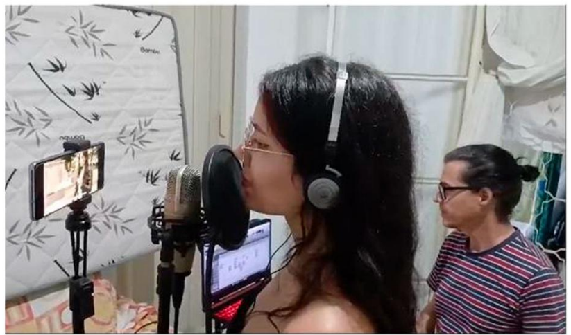
No estúdio profissional ou caseiro, sempre cuidando do som