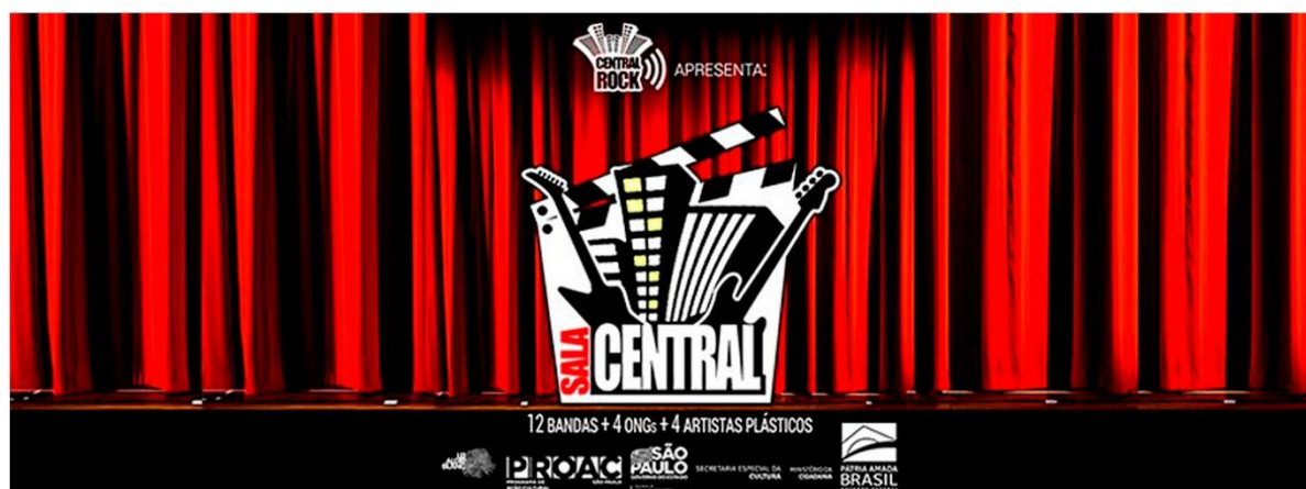
Festival Sala Central (2021)