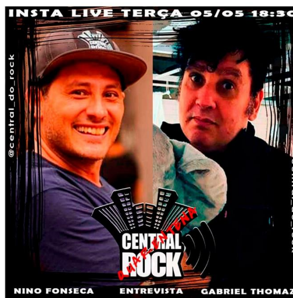
Quarentena: Programa de entrevistas com músicos (2020)