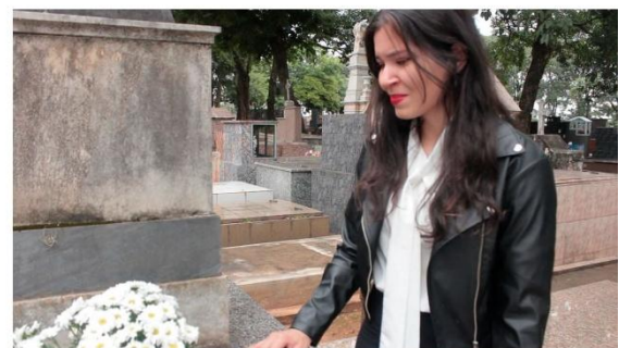
Entre flores e ausências - Poema visual (2025)