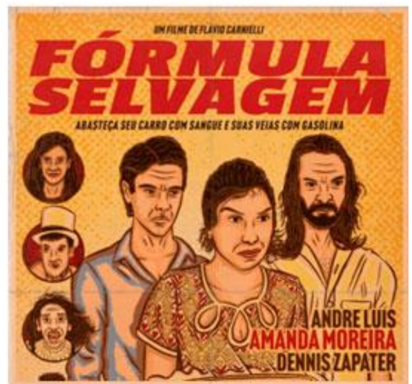
Fórmula selvagem - Sincronização de trilha (2021)