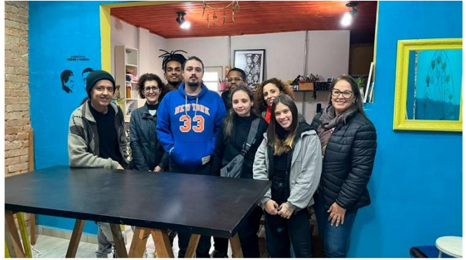
Oficina formativa: Tietê – Reflexos e reflexões