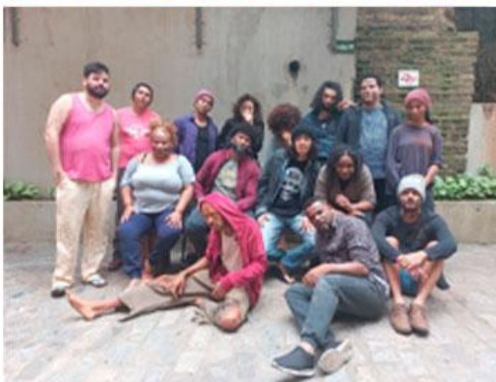
O segurança da tumba - Figuração (2023)