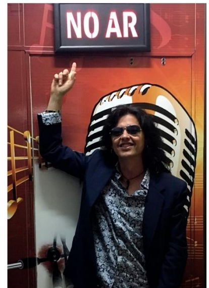
Cantando ao vivo, no estúdio e apresentando Central Station